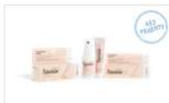
Ламікон® (спрей) (Lamisil)