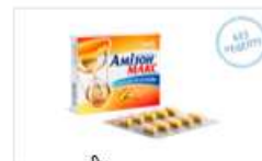
Амізон® Макс (Amizon® Max)

Противірусний препарат для лікування грипу та ГРВІ з вираженим імуномодулюючим ефектом. Завдяки унікальному механізму дії Амізон зупиняє приєднання вірусу до клітин організму, блокуючи їх подальше розмноження. Препарат має додаткові протизапальний, жарознижувачий та знеболюючий ефекти.