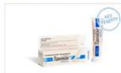
Ламікон® Дермigel (Lamicon Dermigel)