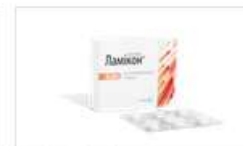
Ламікон® (таблетки) (Lamicon)