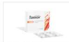
Ламікон® (таблетки) (Lamisil)