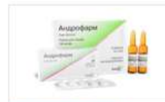
Андрофарм (таблетки) (Androfarm)

Дигідропіридинний антагоніст іонів кальцію другого покоління. Блокує позитивні Ca 2+ -каналі, притуплює трансмембранне переміщення іонів Ca 2+ переважно в клітини гладких м'язів судин і кардіоміоцитів. Має вазодилаторну, антигіпертензивну, антиангінальну властивості.