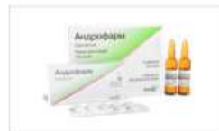
Андрофарм® (розчин) (Androfarm)

У чоловіків – метастазуючий та неоперабельний рак передміхурової залози; патологічне підвищення сексуальної поведінки. У жінок – важкі форми андрогенізації (гірутиї синдром, андрогенна алопеція в поєднанні з вуграми та/або себореєю).